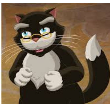
Кот (учёный кот)

Tsar at the Far Away Kingdom 3/9 Vasilisa's father He wants to marry Vasilisa.