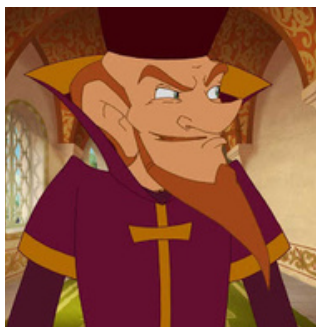
Первый министр царя