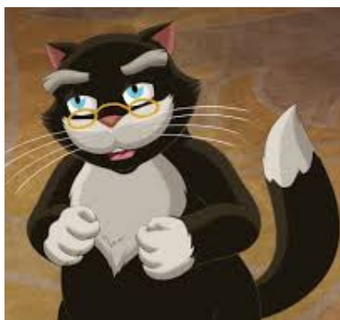
Кот (учёный кот)

Tsar at the Far Away Kingdom 3/9 Vasilisa's father He wants to marry Vasilisa.